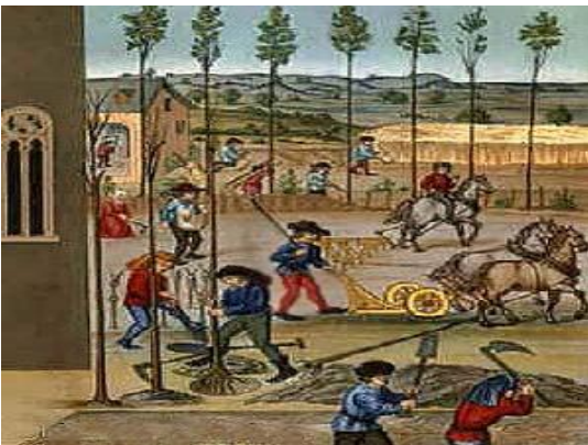
La vida en un feudo

A partir del siglo XI las ciudades europeas volvieron a ser importantes centros comerciales, artesanales y culturales.