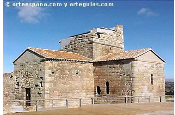
Los visigodos dejaron grandes huellas artísticas en España, como la Iglesia de Santa María de Melque, en Toledo.

AL-ÁNDALUS : los musulmanes conquistaron la Península en el siglo VIII. Entre los siglos X y XI se creó un califato (territorio independiente de Arabia religiosa y políticamente). Destacó el desarrollo de la vida urbana , creándose varios zocos (mercados), el desarrollo de la agricultura con grandes innovaciones y el desarrollo cultural con grandes filósofos.