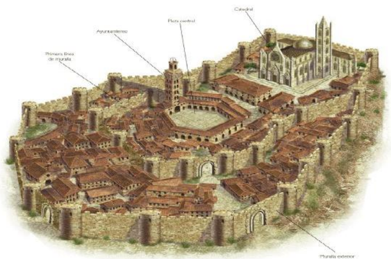
Ciudad medieval →